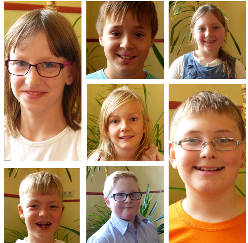
Unsere Erstkommunionkinder 2017